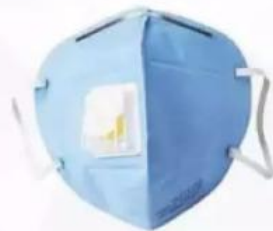
对非油性颗粒的过滤 大于等于95%的口罩

能有效预防呼吸道感染 但佩戴时会有憋气感 包括N95、KN95、DS2、 FFP2 等