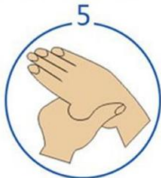
5. 拇指在掌中转搓擦